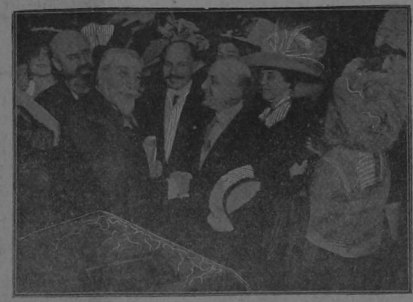
Aquí tienen nuestros lectores el glorioso vóto Anatole France, presidente de primera magnitud de la literatura francesa, dando un cordial apretón de manos a Gabriele D'Annunzio, el gran poeta italiano autor de "El Incoñocato," "El Triunfo de la Muerte," "La Ciudad Muerta," "La Hija de Jorján," etc., quien acaba de consagrarse como poeta francés con "Le Martyre de Saint Sébastien."